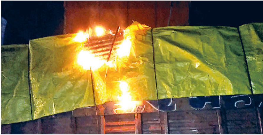
शहजादपुर। तारों से उठती भयानक चिंगारियां।

शहजादपुर मुख्य बाजार में सोमवार देर रात एक बड़ा हादसा होते-होते टल गया, जब सामान से लदा एक कैंटर हाईवोल्टेज बिजली की तारों की चपेट में आ गया। तारों से टकराते ही निकली चिंगारियों से कैंटर की तिरपाल में आग लग गई, जिससे पूरे बाजार में अफरा-तफरी का माहौल बन गया। घटना रात करीब साढ़े नौ बजे की बताई जा रही है। जानकारी के अनुसार अंबाला की ओर से आ रहा कैंटर चालक रास्ता भटक गया और गलती से शहजादपुर के मुख्य बाजार के संकरे रास्ते में प्रवेश कर गया। अंधेरा होने के कारण चालक को ऊपर से गुजर रही बिजली की तारों का अंदाजा नहीं हो सका। जैसे ही कैंटर आगे बढ़ा, वह सीधे हाईवोल्टेज तारों से