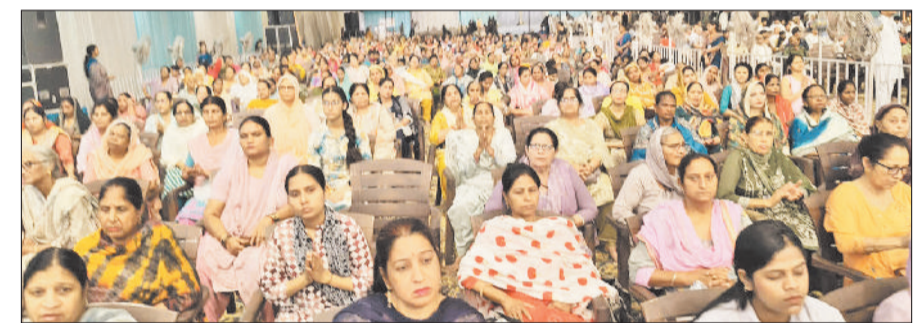
यमुनानगर। जगधारी में आयोजित श्रीमद्भागवत कथा में प्रवचन श्रवण करते हुए श्रद्धालु।