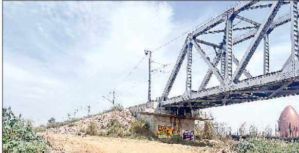
जीटी रोड से रिंगिया मंडी तक फ्रेट कॉरिडोर के साथ प्रस्तावित भूमि जहां नई रोड बननी है।