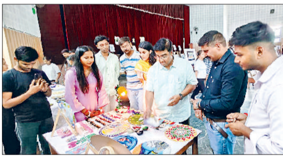
अंबाला। प्रदर्शनी में रखी कलाकृतियों को देखते शिक्षक।